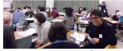
盛り上がるロールプレイ！