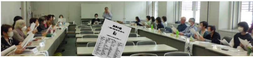
「願ったり叶ったり」のお弁当も美味しかったね～